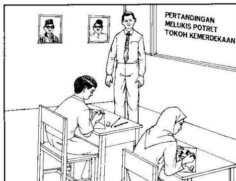
Pertandingan Melukis Potret